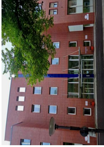
Charité Campus Mitte